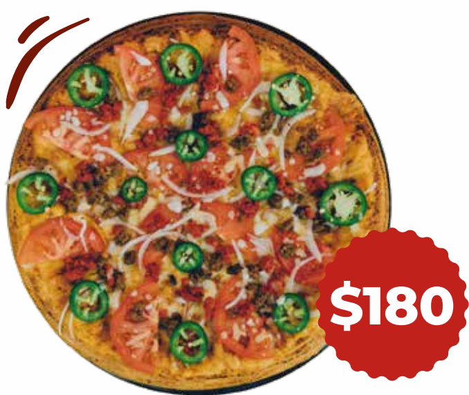
Mexicana Chorizo, carne molida, jitomate, cebolla y jalapeño