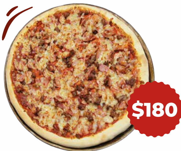
Di Carne Pepperoni, salchicha, tocino, jamón y carne molida.