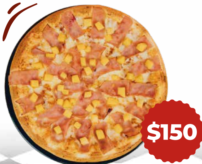
Hawaiiana Jamón y piña